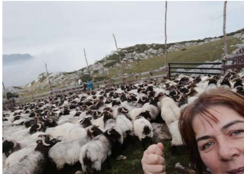
Bejes, Parque Nacional de Picos de Europa, Cantabria.

En muchas ocasiones, algunos conceptos más teóricos, como el de Rural Proofing, provocan en nosotros una sensación de lejanía con respecto a su aplicación. Además, muchas veces no somos conscientes de la importancia de ponerlo en marcha porque no comprendemos de qué manera nos puede estar afectando en nuestro día a día. Por eso, en este apartado hemos considerado relevante ofrecer un total de dos casos reales en los que nos explican de qué manera la legislación impacta negativamente en el medio rural .