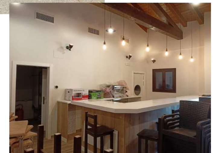
Interior del bar-centro social de Leza de Río Leza.